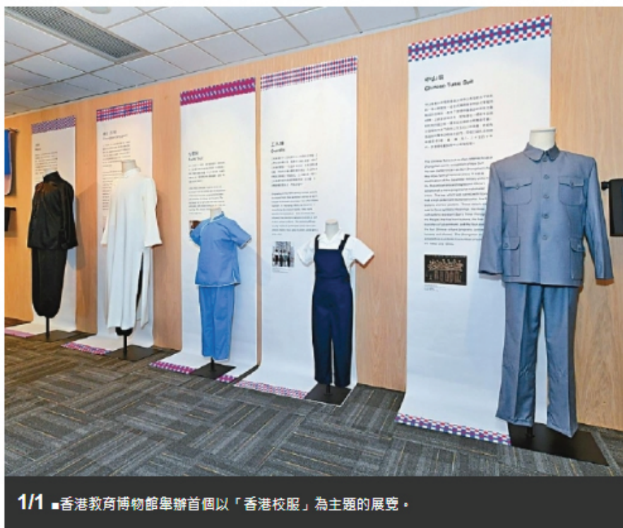
1/1 ■香港教育博物館舉辦首個以「香港校服」為主題的展覽。

Executive日記 - KellyChu 2018-11-29 列印 文字大小